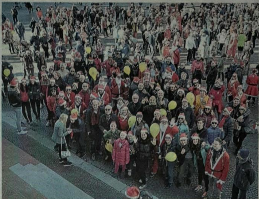
Il colpo d'occhio su piazza Saffi, punto d'arrivo dei due percorsi da effettuare a piedi