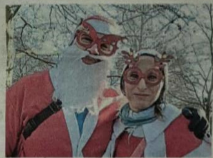
Look adeguato alle feste per alcuni partecipanti