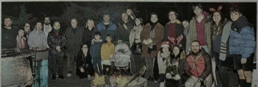
Il tradizionale 'Zoc ad Nadel' acceso al Ronco dal comitato di quartiere: c'erano cento persone in piazza Berlinguer