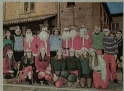
Gli scout dei Romiti vestiti da babbi Natale per la vigilia