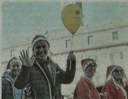
Berrette rosse e palloncini gialli: così si camminava ieri