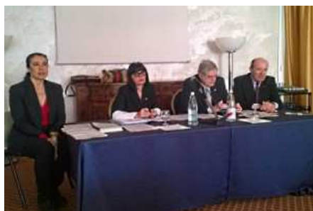
Tavolo presidenziale Lions 19 02 15

(Sesto Potere) – Forlì – 19 febbraio 2015 – A 800 studenti delle classi seconde e terze delle scuole secondarie di primo grado di Forlì e del comprensorio sarà consegnato un questionario, elaborato dai 4 Lions Club di Forlì, per farli riflettere sui condizionamenti e le insidie della rete e dei social network. L’iniziativa sarà finanziata dallo spettacolo ‘Passioni Argentine’ dedicato alle donne e che si terrà domenica 1 marzo al Teatro Dragoni di Meldola. I nuovi Media, in particolare internet e cellulari, rappresentano un aspetto importante nella vita dei giovani della società contemporanea: oggi Facebook e Twitter sono le piazze virtuali dove i giovani si incontrano e comunicano, si scambiano informazioni ed emozioni.